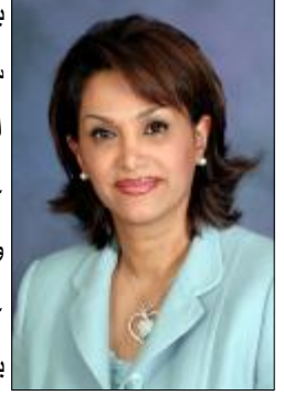
د. ندى حفاظ

كانون الجراية وزيرة شؤون المرأة والأسرة والطفولة والمسنين وعضو المجلس التنفيذي بمنظمة المرأة العربية، الجمهورية التونسية، ورقتي عمل. الأولى بعنوان أمن المرأة وقضايا الصحة قدمتها الدكتورة ندى حفاظ الأستاذة في كلية الطب بجامعة الخليج وزيرة الصحة سابقاً بمملكة البحرين. حيث أشارت الدكتورة ندى أن الأمن والصحة عاملان رئيسيان لاستمرار البشرية وتميبتها، وبالرغم من أهمية الحفاظ على الأمن القومي بمفهومه التقليدي، يجب ألا يكون الإنفاق العسكري على حساب الإنفاق على المشاريع التنموية، موضحة بأن هناك تفاوتاً سائداً بين الدول العربية في المجال الصحي والذي يرجع إلى تفاوت مستويات التنمية، بحيث سيتمكن البعض منها من تحقيق غالبية الأهداف الصحية للألفية بحلول عام 2015، بينما لن يتمكن البعض الآخر من تحقيق أي منها.