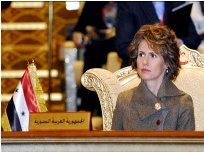
السيدة أسماء الأسد حرم فخامة رئيس الجمهورية العربية السورية

(٢) انعدام الأمن المرتبط بالعنف الفردي، (٣) انعدام الأمن المتصل بهشاشة الأوضاع الاقتصادية والاجتماعية للمرأة.