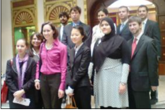
الاتحاد النسائي في العام في 12 يناير 2009.

قام وفد يضم 12 طالبا وطالبة بتخصص الماجستير في الدراسات الشرق أوسطية من جامعة جونز هوبكنز بولاية واشنطن بزيارة