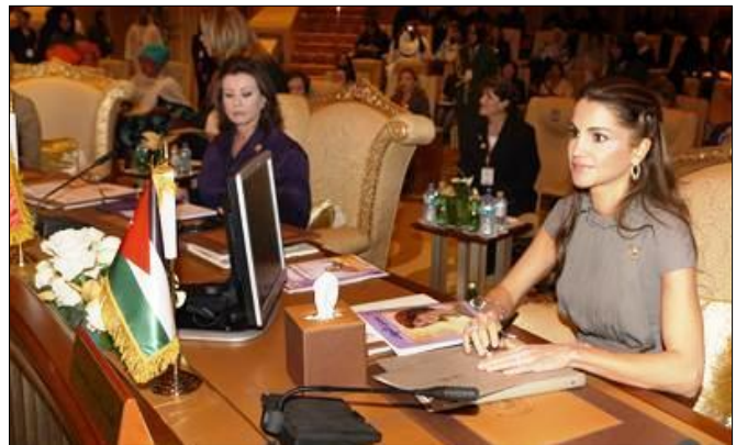
صاحبة الجلالة الملكة رانيا العبدالله قرينة عاهل المملكة الأردنية الهاشمية

هذا وقد عقد على هامش المؤتمر جلسة تعريفية بمؤسسة المرأة بدبي، ومشروع تشغيل المرأة الريفية التابع لمنظمة العمل العربية.