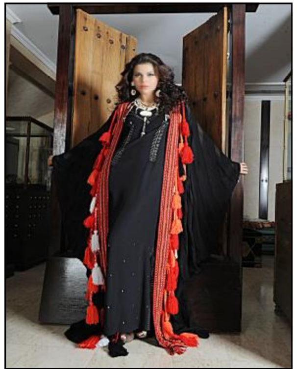
مرواح: عباءة محلاة بأشكال السدو