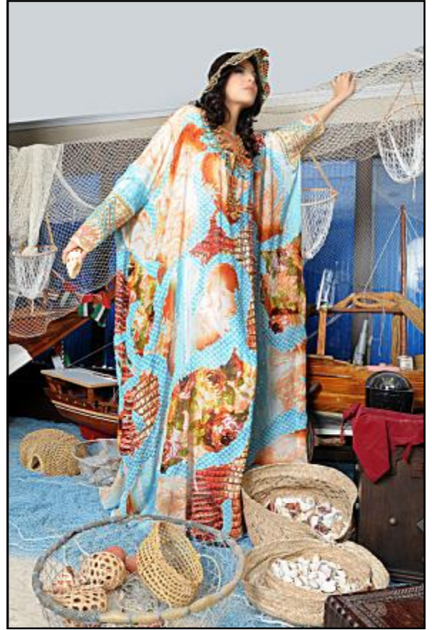
النيسر من مفردات البحر

الإماراتية مع المحافظة على طابعها العام. وقد جاءت مجموعة (أصايل إماراتية) تنبض بالهوية الإماراتية من مفردات البحر، صيد السمك، صناعة الخيم، رياضة القنص.