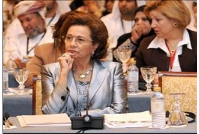
السيدة سوزان مبارك قرينة رئيس جمهورية مصر العربية

دائما تتصارع فيه فئات متحاربة داخل الدولة دون أي اعتبار للحفاظ على القيم المثلى أو تطبيق بنود القانون الدولي واحترام حقوق الإنسان.