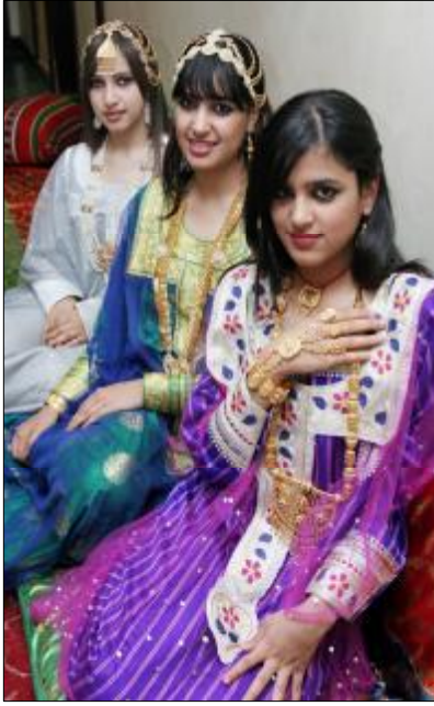
نماذج عن الأثواب التقليدية مع الحلي

المرأة على تطريز الأقمشة باستخدام الخوار المتمثل في زخارف مصنوعة من الخيوط الفضية أو الذهبية باستخدام مكائن الخياطة، وغالباً ما تتشابه هذه التطريزات في مفرداتها مع الأشكال الموجودة على أصل القماش.