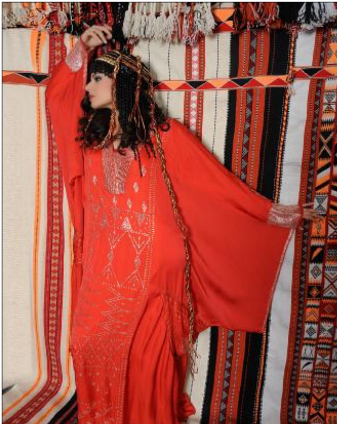
سدو: منقذ بالفضة بأشكال السدو الإماراتي