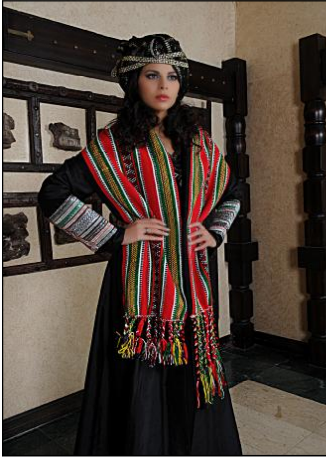
مسراح: تحاكي رحلة الذهبات للقنص محلاة بأشكال السدو والتلي

الإماراتية مع المحافظة على طابعها العام. وقد جاءت مجموعة (أصايل إماراتية) تنبض بالهوية الإماراتية من مفردات البحر، صيد السمك، صناعة الخيم، رياضة القنص.