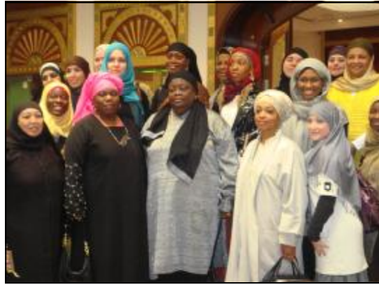
العام في 11 يناير 2009، وذلك خلال

قام وفد يضم 21 سيدة أميركية مسلمة بزيارة الاتحاد النسائي